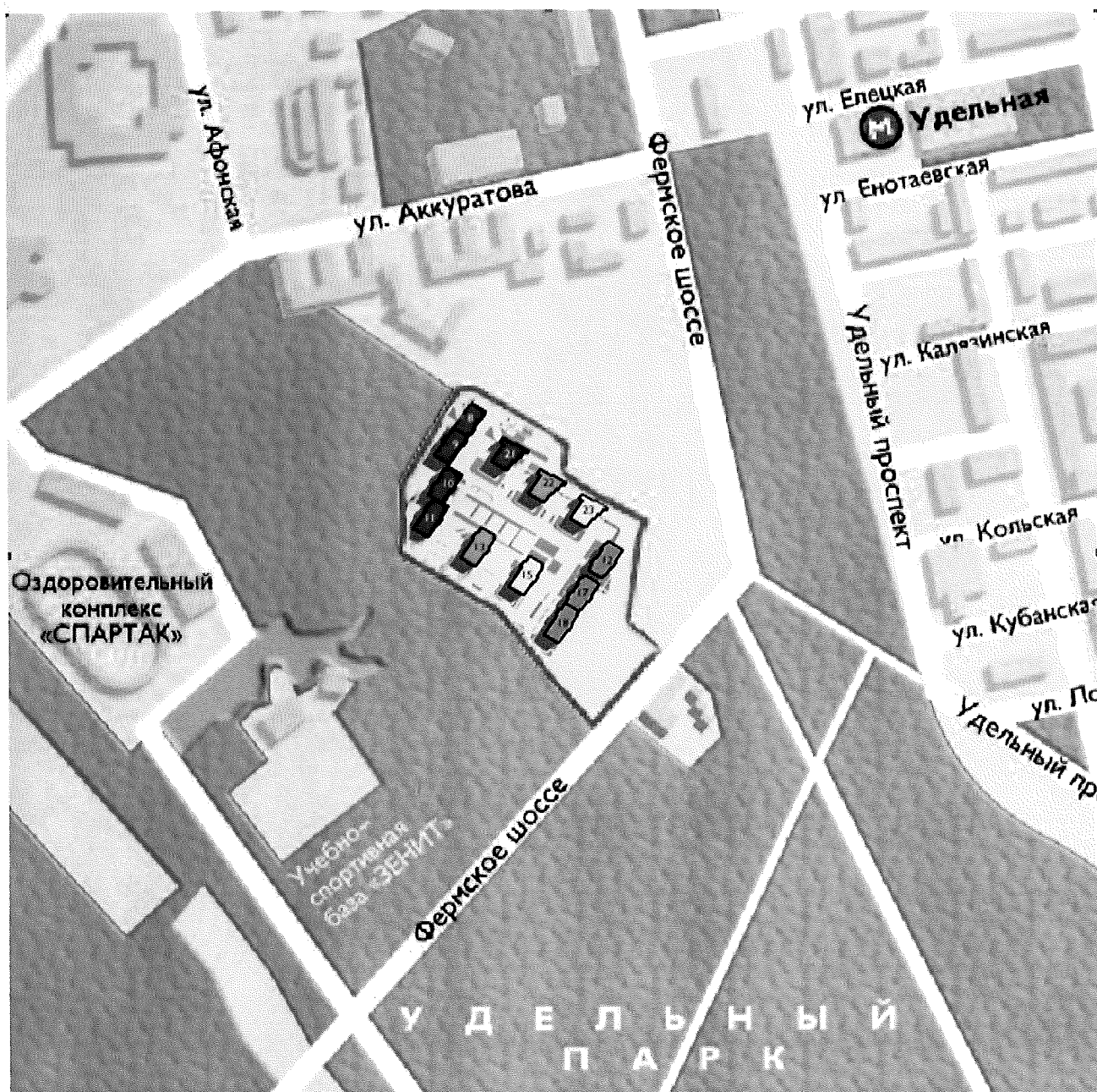
СХЕМА РАЗМЕЩЕНИЯ ОБЪЕКТА

Приложение № 2 к Проектной декларации от 30.10.2015 г. О проекте строительства комплекса жилых домов со встроенно – пристроенными помещениями, 1-4 этап строительства, корпуса 8-9, 10-11, 12, 13, 15, 17-18, 21, 22, 23 и пристроенной автостоянки по адресу: г. Санкт-Петербург, Фермское шоссе, д.22, литр В