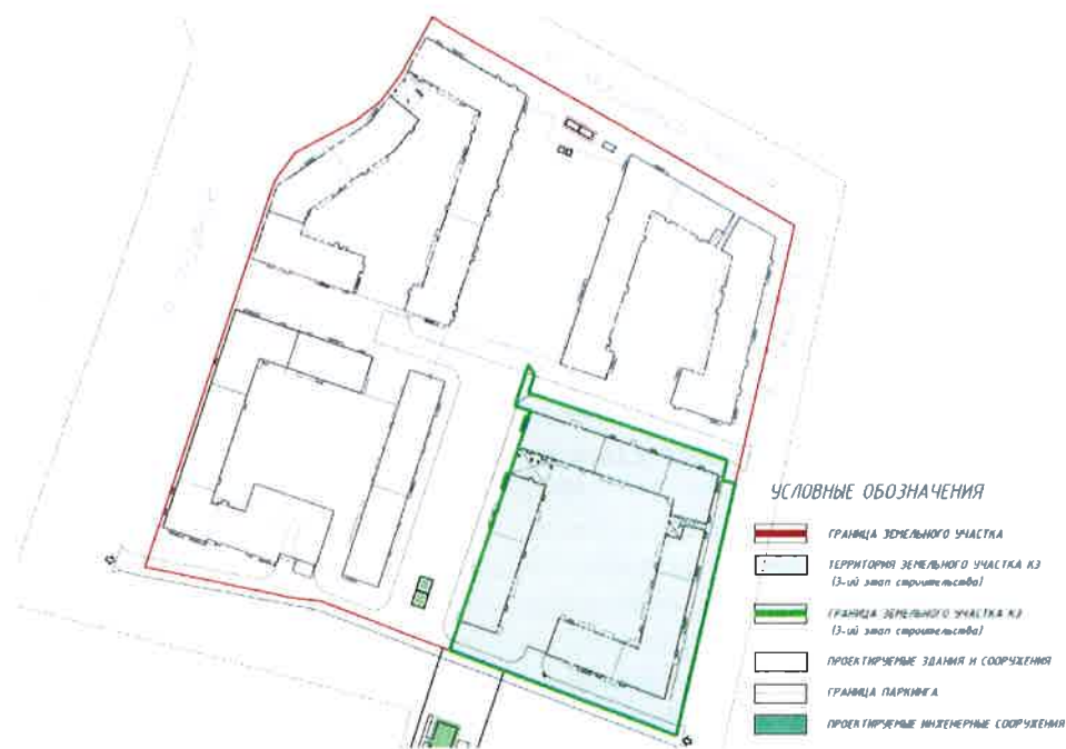
СХЕМА РАЗМЕЩЕНИЯ ОБЪЕКТА